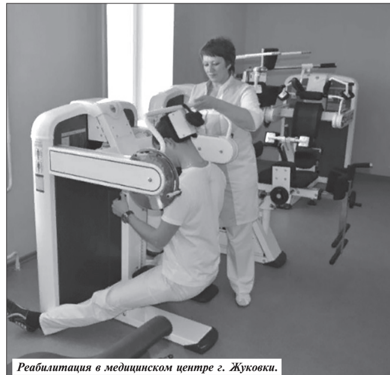
Реабилитация в медицинском центре г. Жуковки.