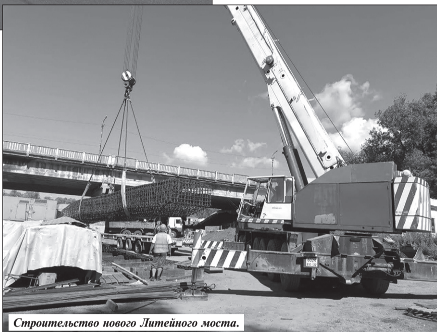
Строительство нового Литейного моста.

При этом стоимость моста гораздо ниже, чем требовали люби-